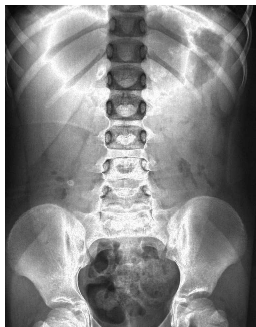
Figura 2 Relieve-radiografía de abdomen.

Actualmente las imágenes en relieve se pueden conseguir con editores gráficos mediante sistemas informáticos, reduciendo su uso a fines ilustrativos y educativos 5 . No obstante, hasta la primera mitad del siglo xx, la relieve-radiografía fue considerada por algunos profesionales un complemento importante de la radiografía convencional. En su momento, se creía que iba a ser de gran ayuda en el campo de la radiología diagnóstica, al resultar más fácil de reconocer las sombras de los órganos abdominales o los riñones. El tiempo ha demostrado, sin embargo, que las radiografías