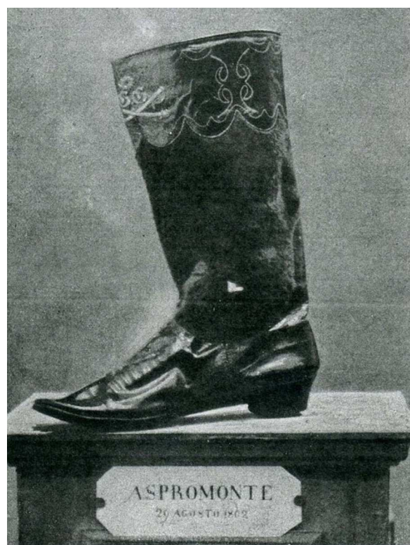
Figura 2 La bota que usó Garibaldi en Aspromonte, con el orificio de entrada de la bala (Museo Cívico del Risorgimento di Bologna).

septiembre marchó hacia la prisión de Varignano para dar su opinión sobre la herida. Una vez recibido cortésmente por los asistentes médicos de Garibaldi, examinó al paciente y explicó que la bala no se hallaba en la articulación ni estaba alojada en otro lugar. Aún así, algunos médicos italianos seguían sosteniendo que esta se encontraba en el tobillo. La lesión, mientras tanto, no mejoraba y, dada su gravedad, un cirujano vienés hasta planteó la posibilidad de una amputación 2-4 .