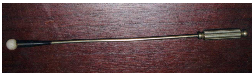
Figura 4 La sonda de Nélaton.

bien entrado el siglo XX se lo consideraba parte esencial del equipo de los cirujanos militares o navales. Incluso, llegó a usarse en el presidente norteamericano Abraham Lincoln para ubicar la bala que estaba alojada detrás de su órbita luego del atentado que acabó con su vida el 14 de abril de 1865 6 .