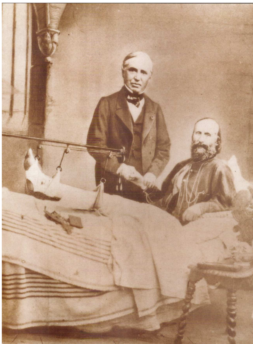
Figura 3 Retrato de Auguste Nélaton y Giuseppe Garibaldi estrechando manos (nótese que el cirujano francés está comprobando con su mano izquierda el pulso arterial de su paciente). Garibaldi, herido y tendido en la cama, acaba de recibir la noticia de que su pierna no será amputada.