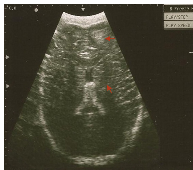
Figura 2 Ecografía transcraneana en proyección axial del mismo paciente. Se evidencia una contusión hemorrágica (flecha).