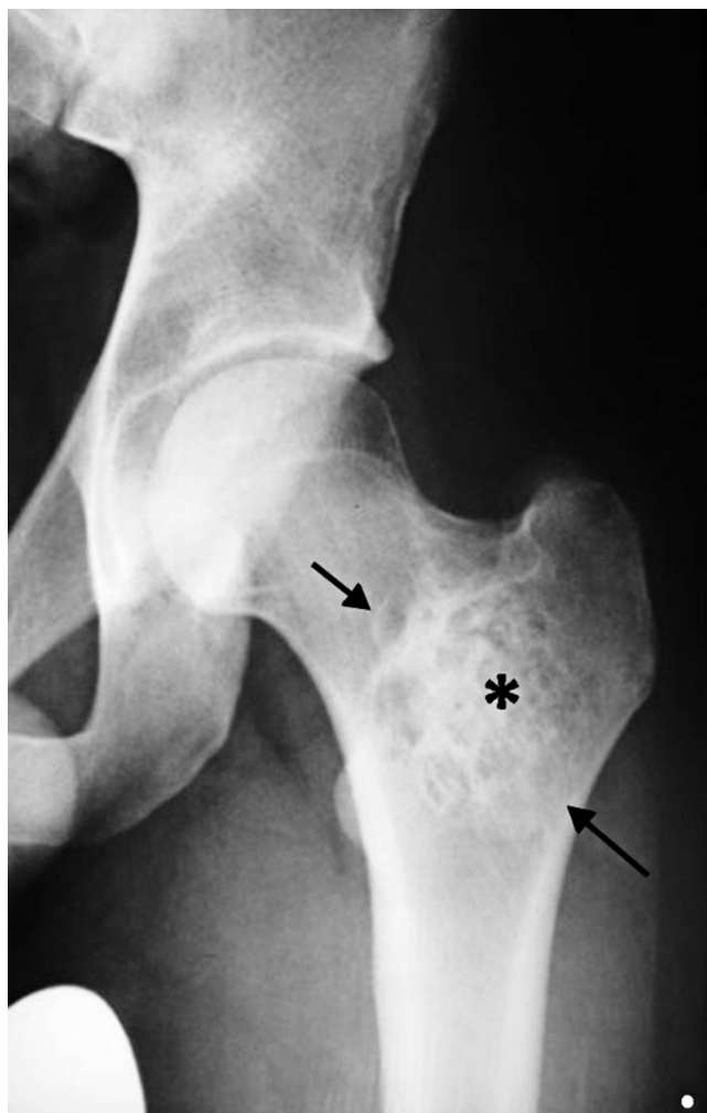
Figura 1 Radiografía de frente de cadera izquierda: se observa una lesión geográfica de márgenes bien definidos en la región intertrocanterica del fémur (flechas). A su vez, se evidencian contornos escleróticos y matriz ósea mineralizada en su interior (*), sin cambios expansivos en el hueso adyacente.

A menudo los tumores óseos se detectan casualmente, al realizar una radiografía en busca de otras entidades patológicas. Ante su presencia, lo más importante es determinar