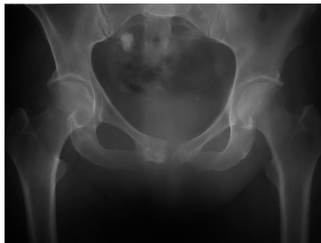
Figura 1 Radiografía de pelvis: se observan signos de rarefacción y destrucción ósea de la rama pubiana izquierda con esclerosis parcial de la rama derecha, diastasis de la sínfisis pubiana y calcificación inespecífica en la porción superior de la pelvis.

Ante el deterioro clínico de la paciente, los hallazgos imagenológicos sugestivos, la leucocitosis, la proteína C reactiva (PCR) y la velocidad de sedimentación globular (VSG) elevadas, se llevaron a cabo hemocultivos y una punción articular del pubis bajo control radioscópico, rescatándose una pequeña muestra que fue enviada al labo-